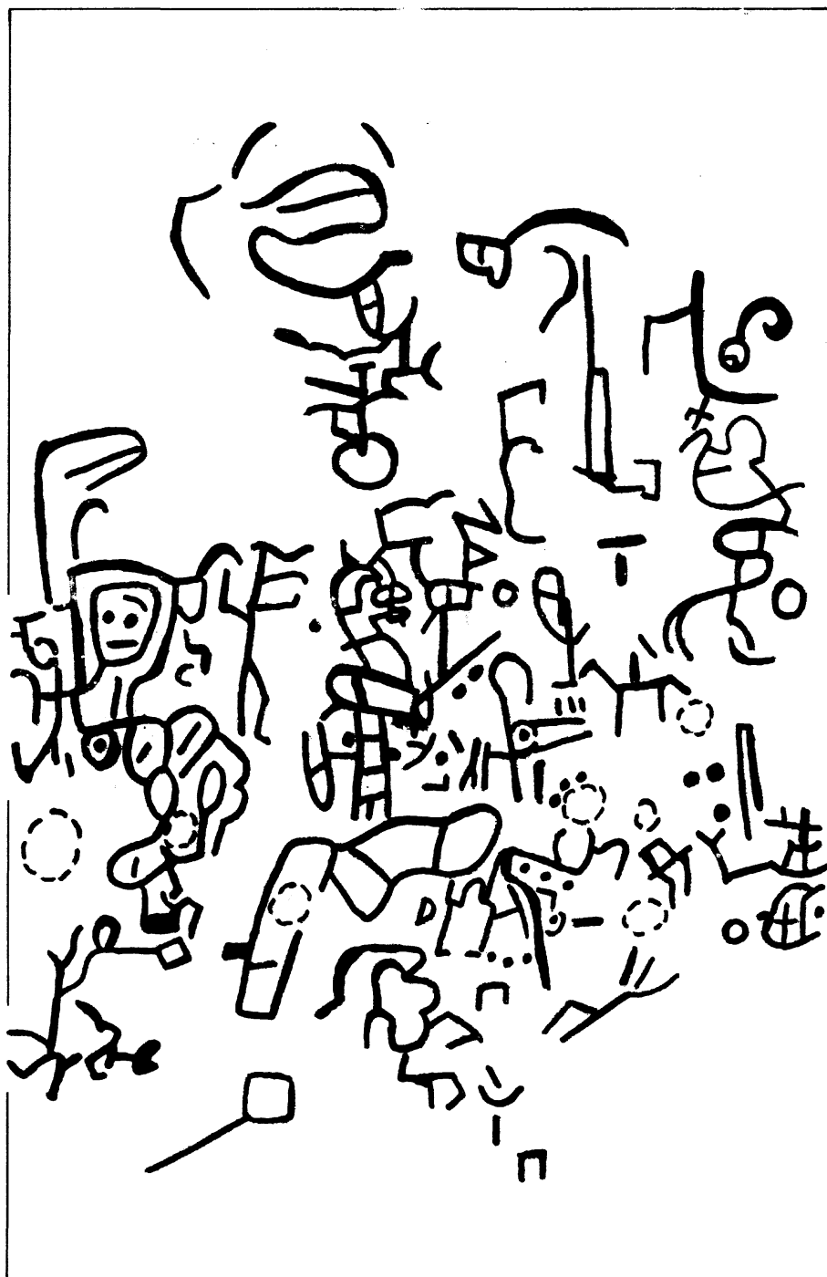
Fig. 2. Continuación hacia el lado derecho del sector central de los petrograbados del Río Titihuapa.