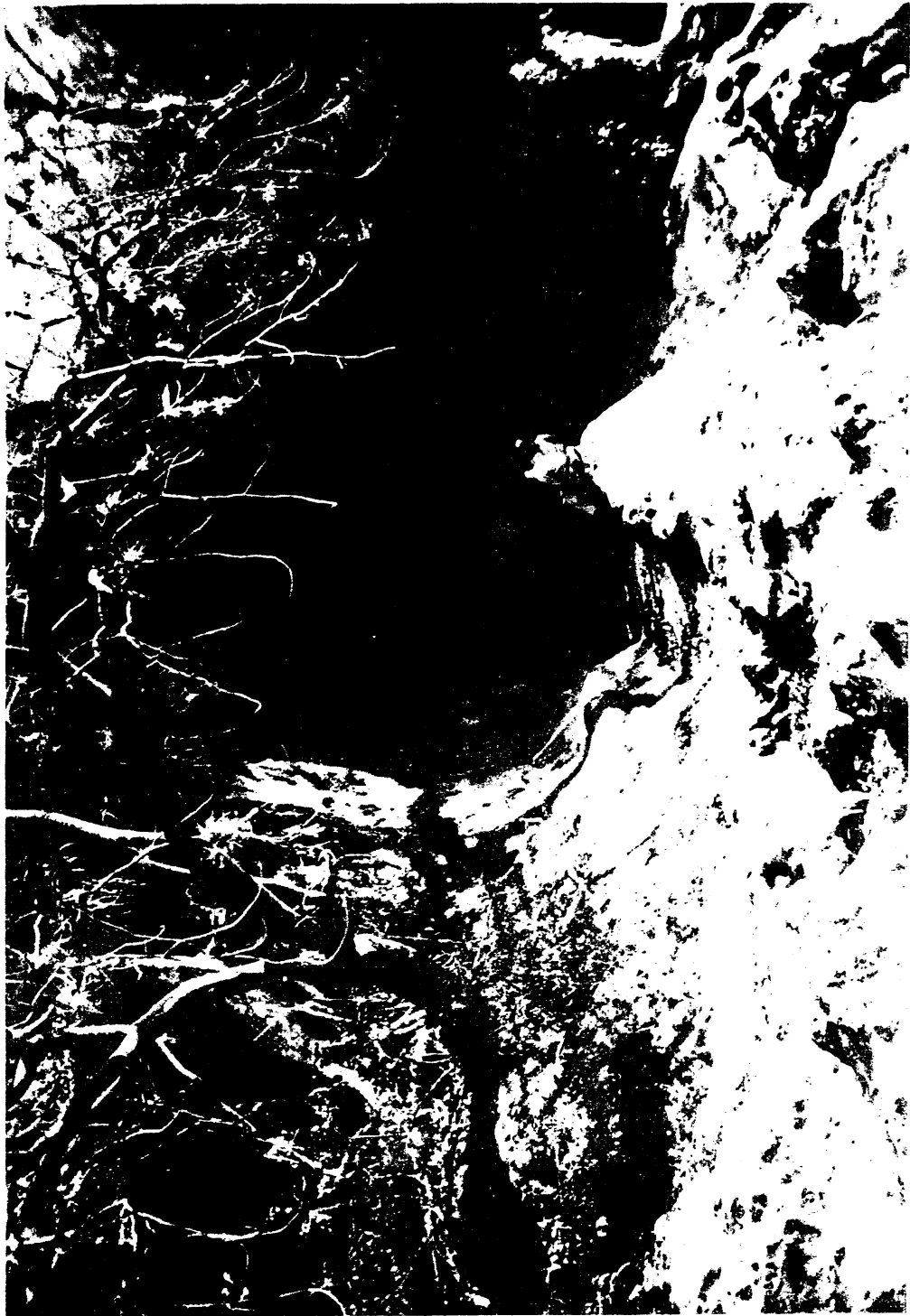
Foto 1. Vista general de la cueva al lado sur del Río Titihuapa donde se encuentran los petrograbados.