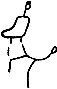
Fig. 3 Figura de un mono (?), petrograbado del Río Titiuhupa.

dibujos. La mayor parte consiste de líneas irregulares, algunas veces curvas, otras veces rectangulares, o una mezcla de ambos tipos. Unas de ellas parecen letras chinas como las de abajo en la parte izquierda de la figura 1, pero esta semejanza es puramente casual. Como en muchísimos otros petrograbados de América también es difícil, o aun imposible en estas formas entender el sentido de los signos, y uno se inclina a pensar que el origen de ellos tiene su motivo, en la mayoría de los casos, en una especie de juego. Aun puede ser que después que alguien hubiera comenzado con los dibujos, y que otros de los indios antiguos hayan seguido en grabados, que se pudieran haber ocultado los motivos originales.