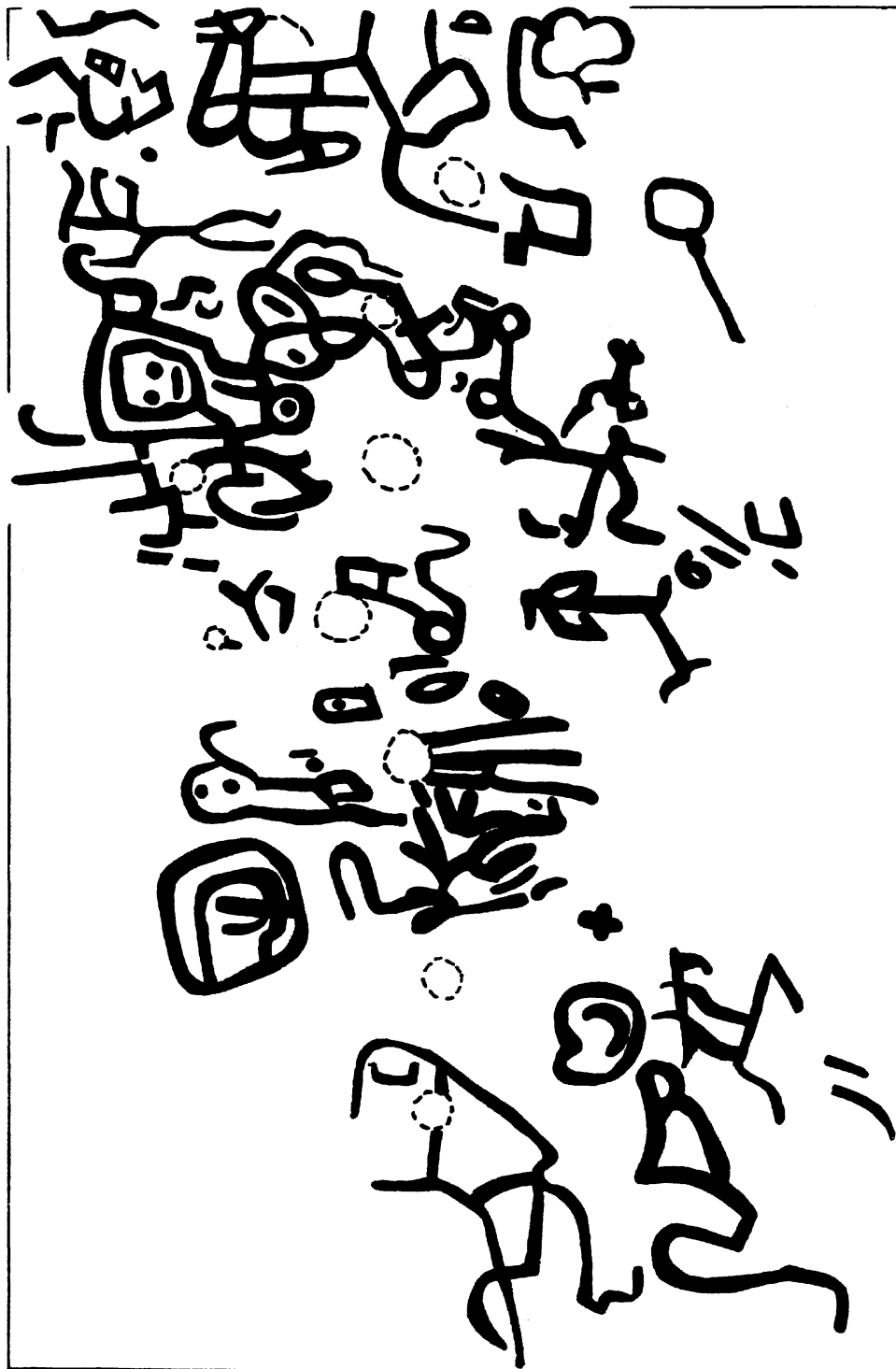
Fig. 1. Este dibujo demuestra el sector central de los petrograbados del Río Titihuapa.