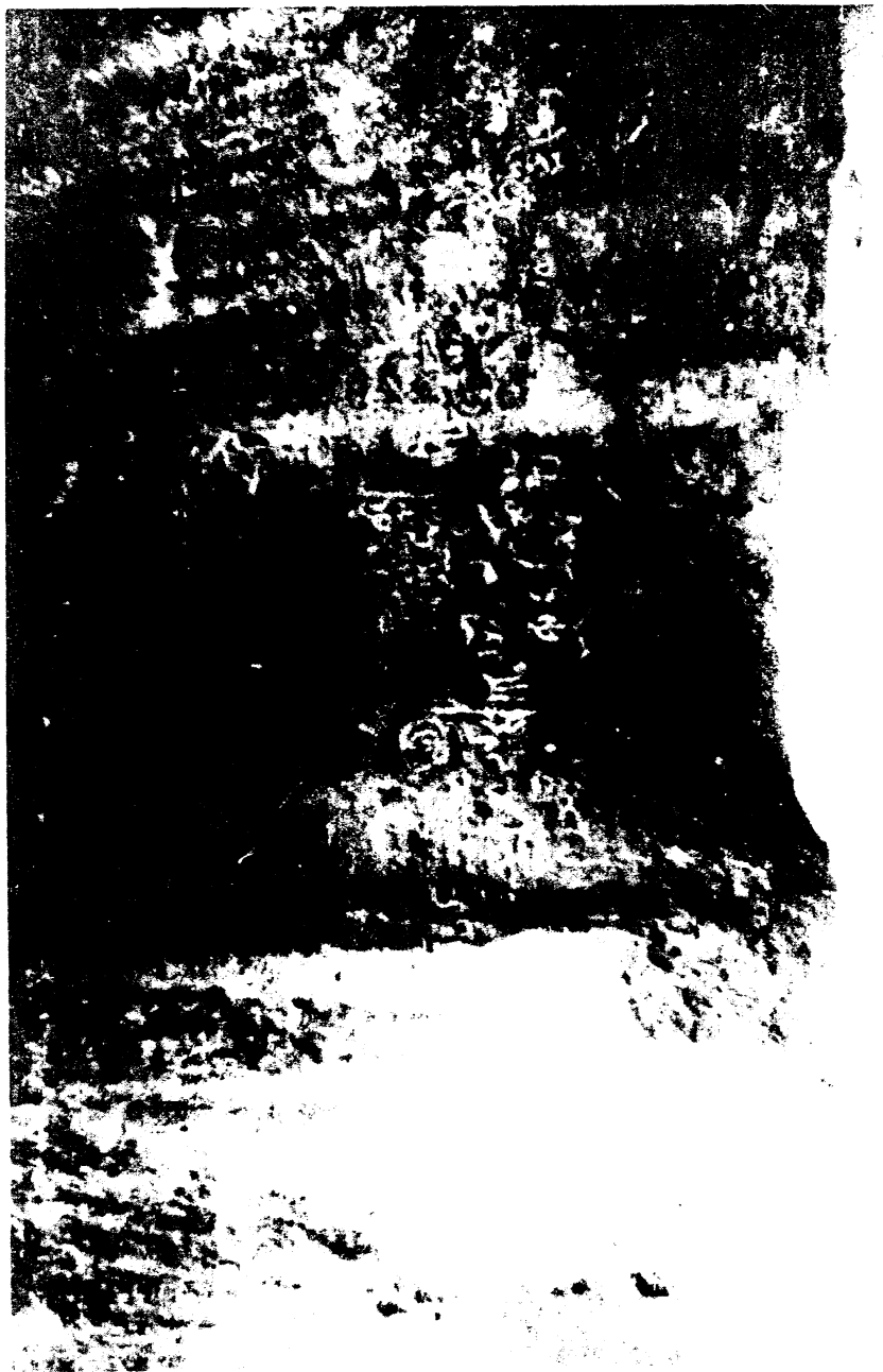
Foto 2. Demostración de la parte central de los petrograbados del Río Titihuapa.