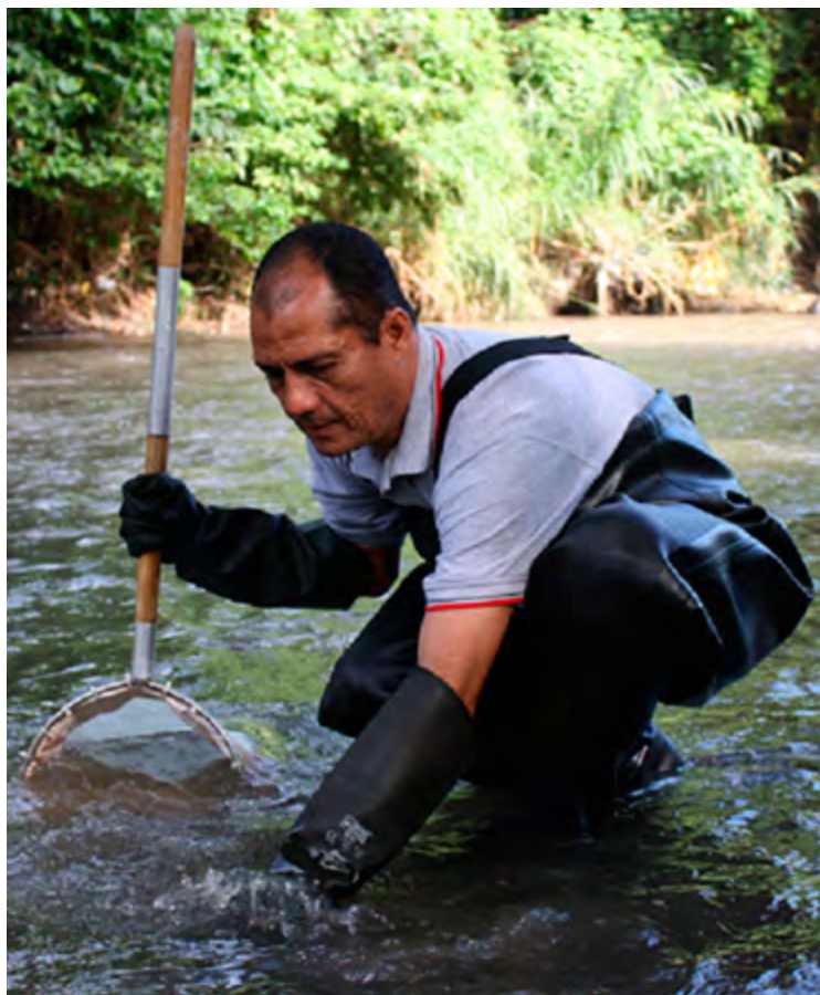
Fig. 1. Muestreo de macroinvertebrados acuáticos con red D

Los resultados obtenidos en el biomonitoreo realizado por el equipo de técnicos involucrados en el proyecto señalan que el 5.4% de los sitios muestreados tienen agua de calidad “buena”; mientras que el 21.4% se clasifican como “regular”. Cabe destacar que más de la mitad de los puntos o sitios estudiados se ubican en la categoría de “regular –pobre” (26.8%) y pobre (33.9%). Finalmente, un 12.5% se clasificaron como “muy pobre”, es decir son lugares altamente contaminados. En esta categoría se encuentran los ríos Acelhuate, Suquiapa, San Antonio y Sensunapán.