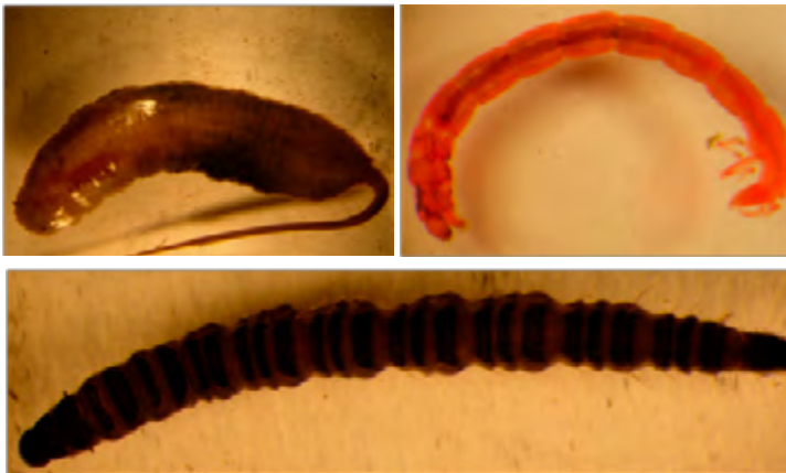
a) Larva cola de ratón (Orden Diptera y Familia Syrphidae); b) Larva quironomido (Orden Diptera y Familia Chironomidae); moscas de los baños (Orden Diptera y Familia Psychodidae)