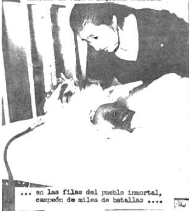
... en las filas del pueblo inmortal, campeón de miles de batallas ....