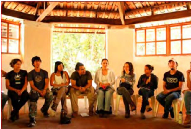
Inicio del Convivio Navideño en Parque Nacional Montecristo, diciembre 2012.