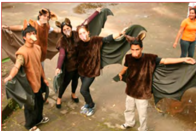
Miembros del PCMES haciendo una presentación artística en el Parque Zoológico Nacional, octubre 2011.