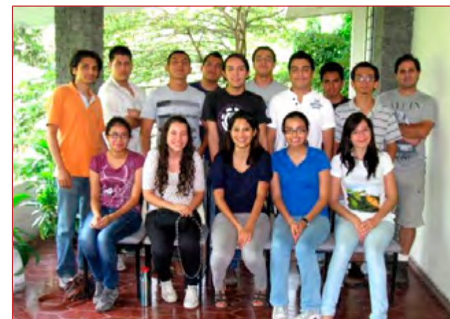
Reunión del PCMES en Industrias Verdes, julio 2012. Por: Melissa Rodríguez