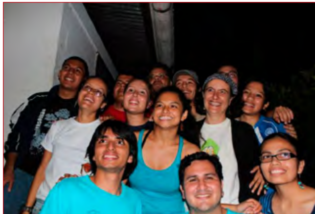
Miembros PCMES que participaron del Taller de Educación Ambiental en el Parque Nacional El Imposible, El Salvador, octubre 2012.