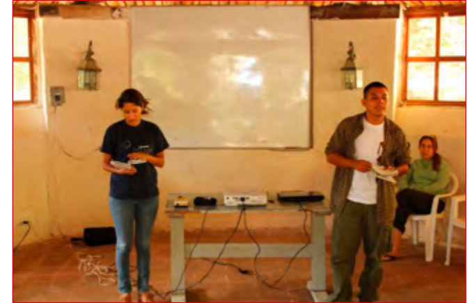
Presentación de Artículos científicos en Convivio Navideño en Parque Nacional Montecristo, diciembre 2012. Por: Melissa Rodríguez.