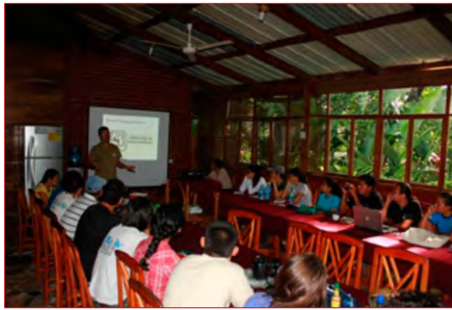
Participantes de PCM de Guatemala, Honduras, El Salvador, Nicaragua y Costa Rica en Taller de Educación Ambiental, octubre 2012.