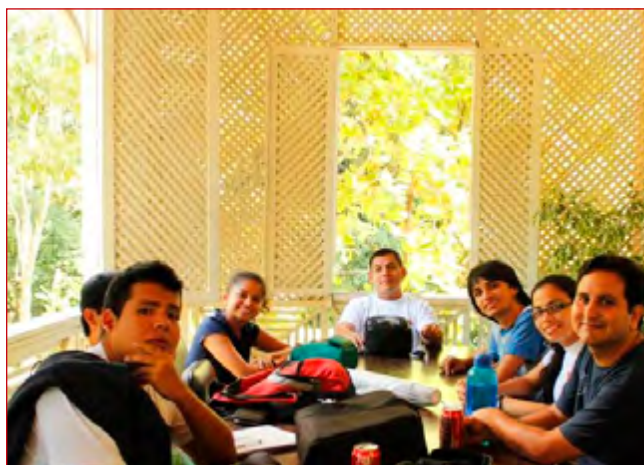
Reunión del PCMES en MUHNES, octubre 2012.

Mes a mes el Programa de Conservación de murciélagos se reúne con los miembros para dar seguimiento a los planes y actividades propuestos dentro de la Línea de trabajo del Programa. En estas reuniones se hacen repastos de las familias de murciélagos, se discuten artículos, se hace la planificación anual y se organizan actividades para dar a conocer a las especies de murciélagos y promover su conservación.