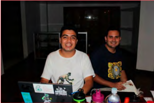
Miembros PCMES en mesa de trabajo durante Taller de Sistemática en el Jardín Botánico Lancetilla, Honduras, agosto 2012.