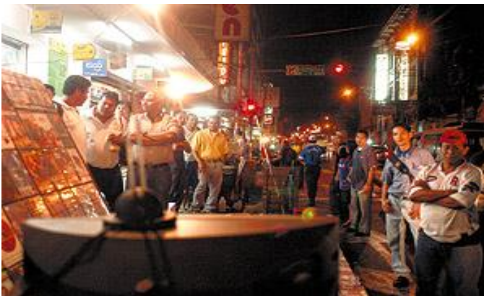
Foto tomada en el centro de San Salvador, a la altura del parque San José, Revista Vértice, 29 de Mayo de 2005.