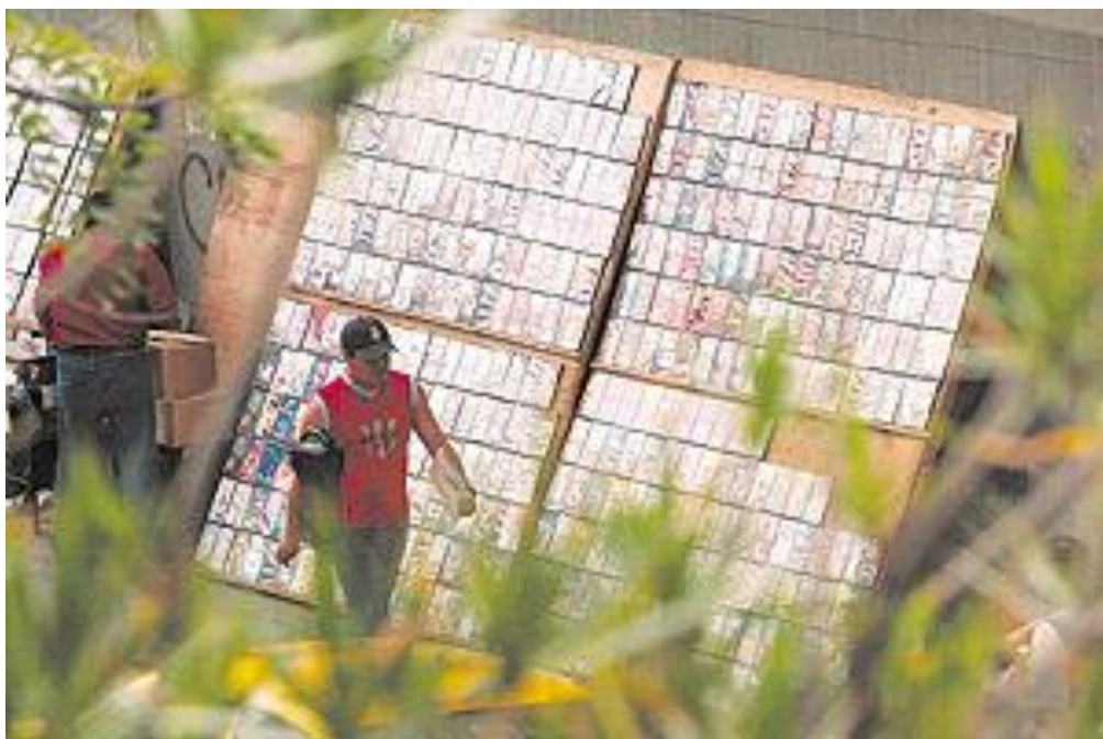
Foto tomada en la Calle Arce, en el centro de San Salvador, Revista vértice, 29 de Mayo de 2005

Es así como en esta historia, los vendedores de la calle son sólo la cara visible, la infantería de una actividad ilícita que se gesta en las trincheras más insospechadas, entre paredes de aluminio y sin levantar sospechas, se instala una computadora y varios aparatos de reproducción de DVD además de contar con esta tecnología también cuentan con transporte para poder movilizar el material ilícito.